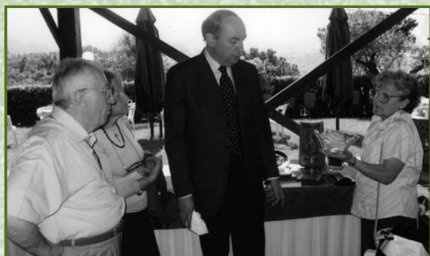
Incontri alla festa di chiusura