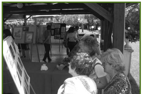
Alcune immagini della Festa di chiusura