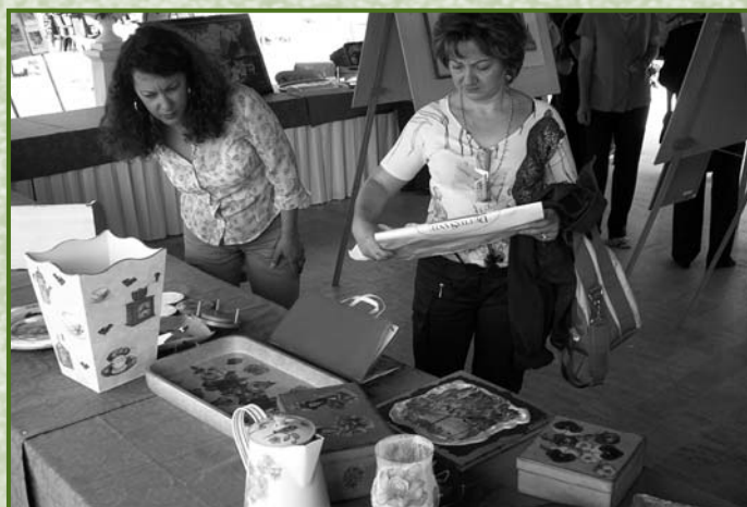
Alcune opere in mostra alla festa di chiusura