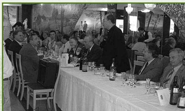
Festa di chiusura