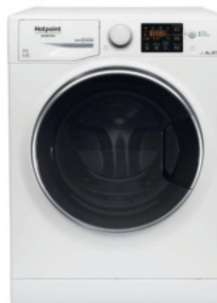
RPG 826 DD IT