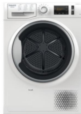
NT M11 92E IT