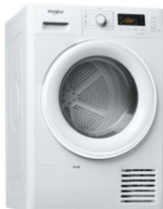
FT M11 8X3 EU