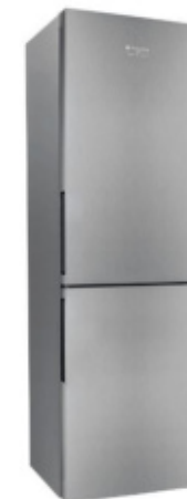
XH8 T3U X