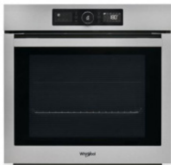
AKZ9 6280 IX